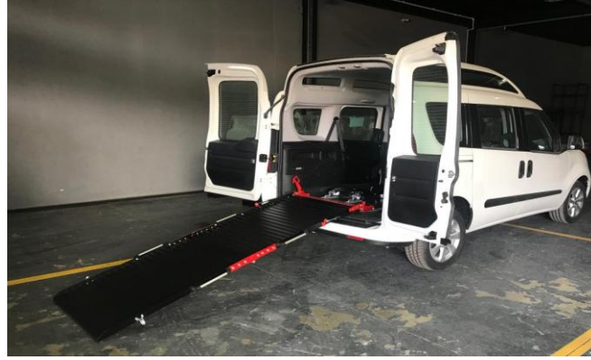
Engelli Rampası açık konum görüntüsü