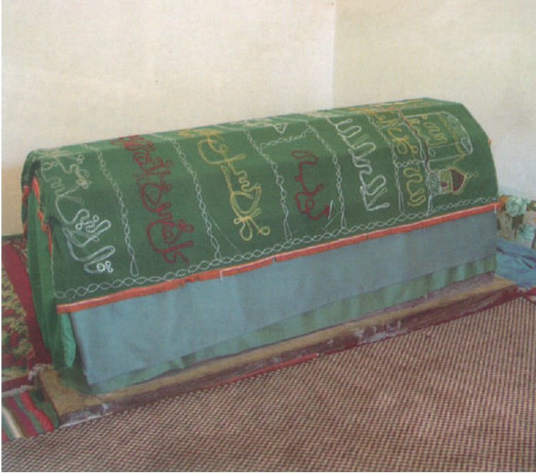
Elvan Çelebi'nin Kabri