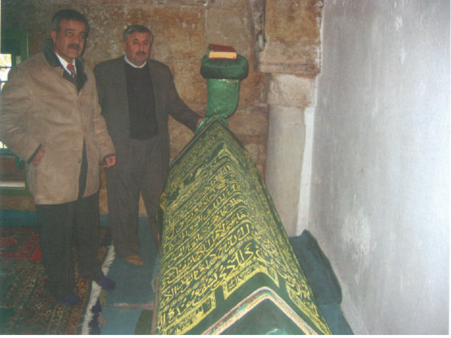
Âşık Paşa'nın Kabri