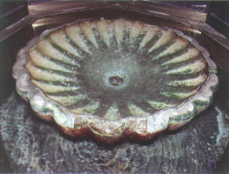
Şadırvan İçindeki Tarihi Çanak