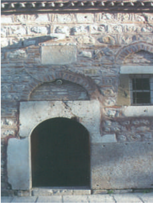
Şadırvan, Camii ve Türbenin Girişi