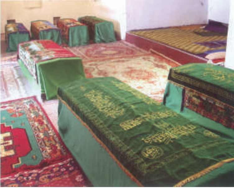
Elvan Çelebi'nin Yakınlarının Kabri