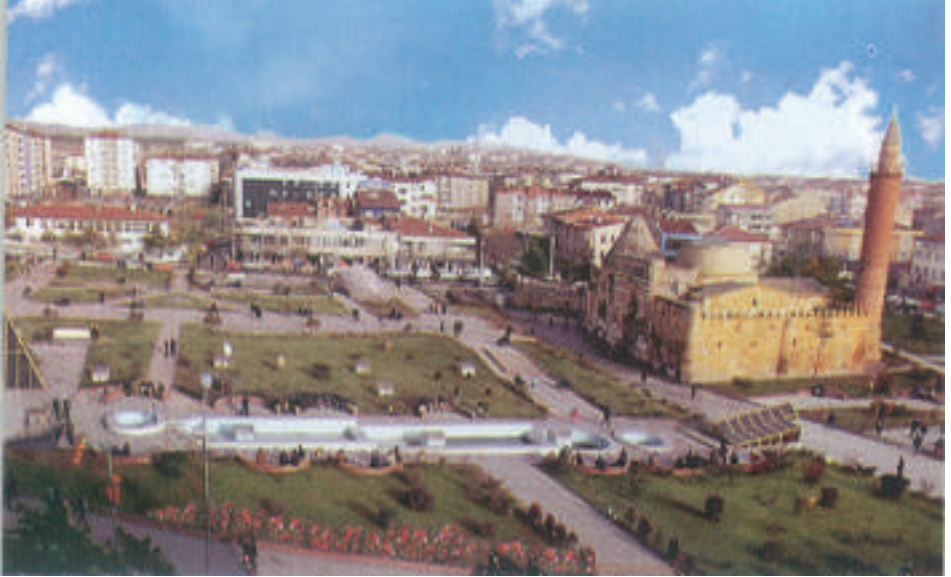
Cacabey Külliyesi- Kırşehir