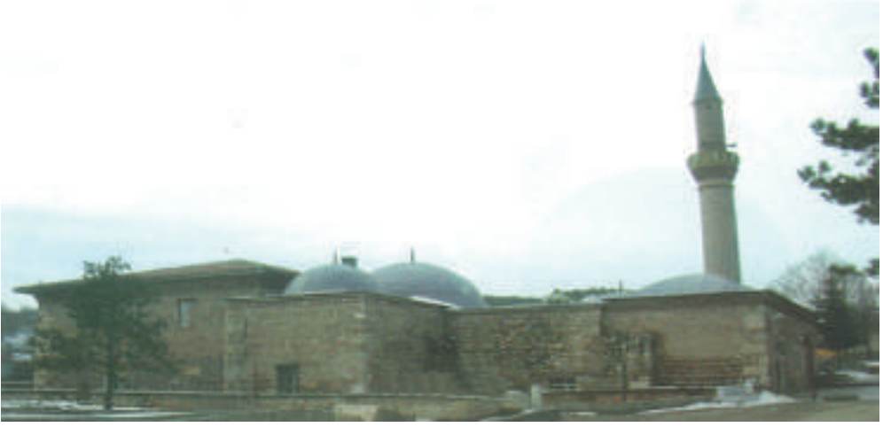
Elvan Çelebi Külliyesi