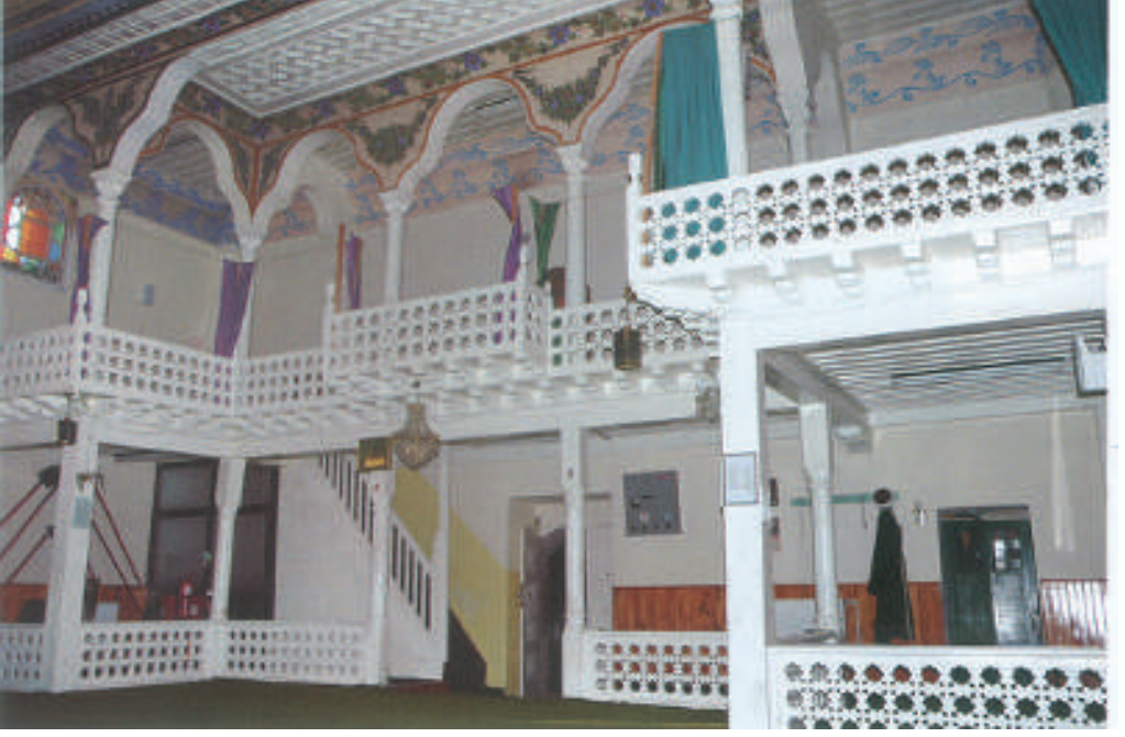
Caminin İçinden Bir Görünüm