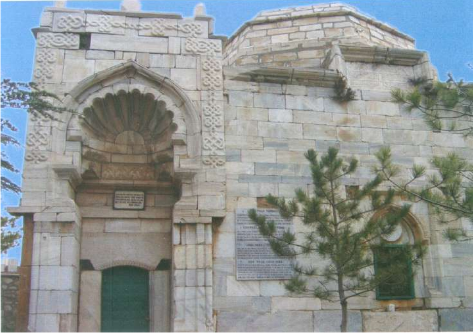
Âşık Paşa Türbesi