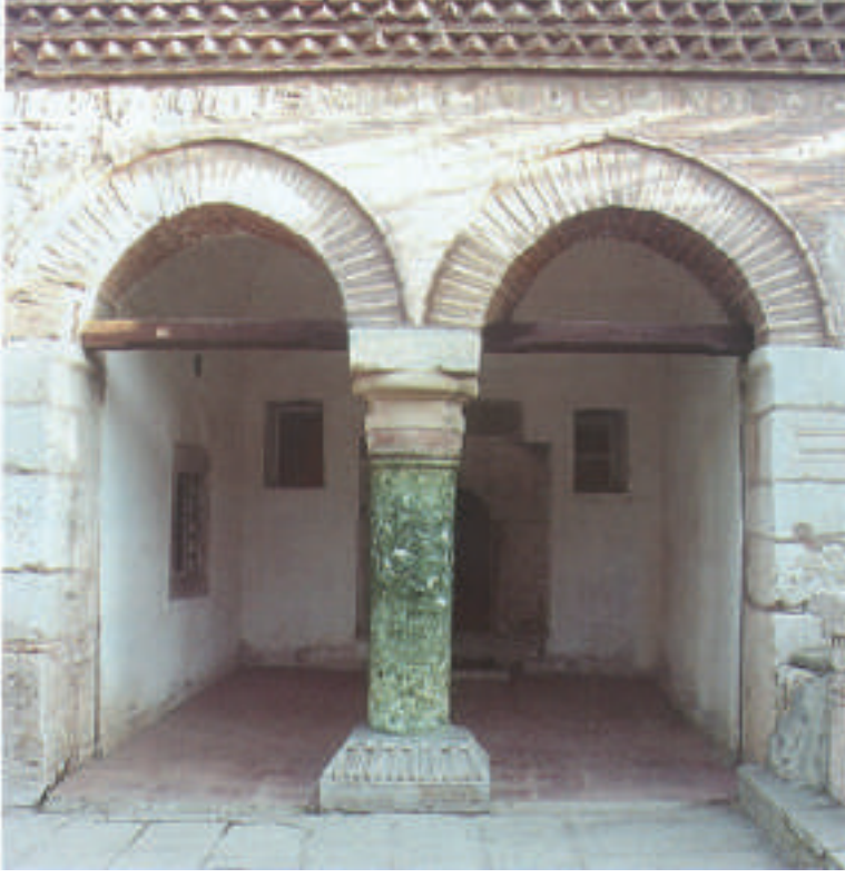
Türbe Girişindeki Yeşil Direk