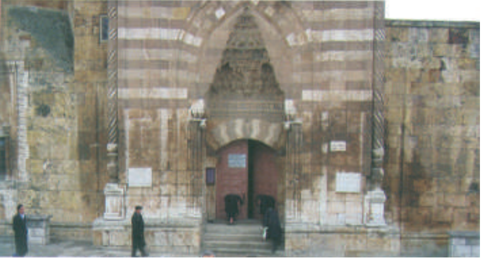
Cacabey Medresesi'nin Girişİ