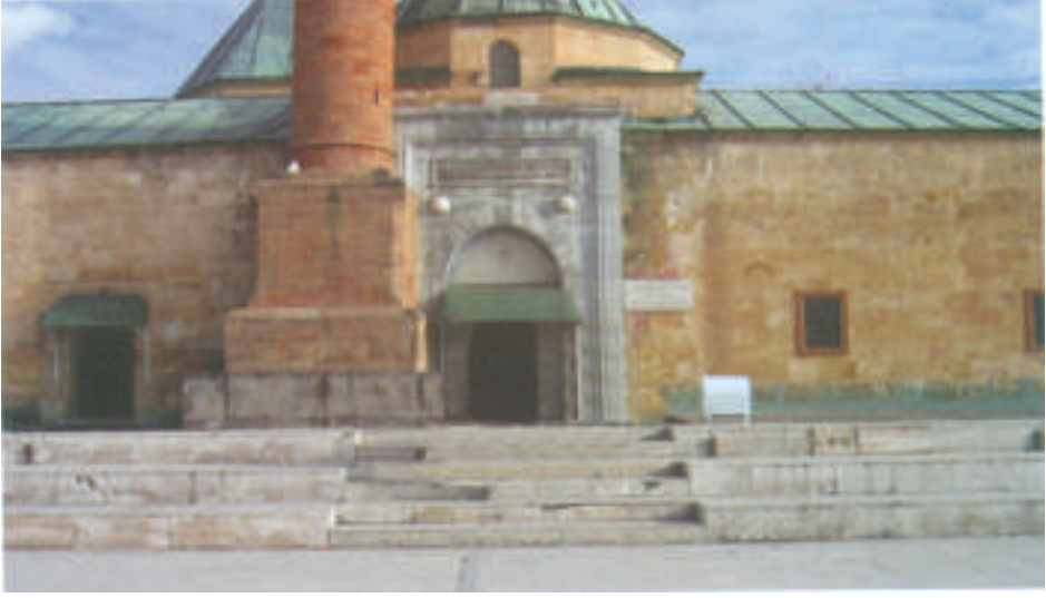
Ahi Evran Camii Girişı