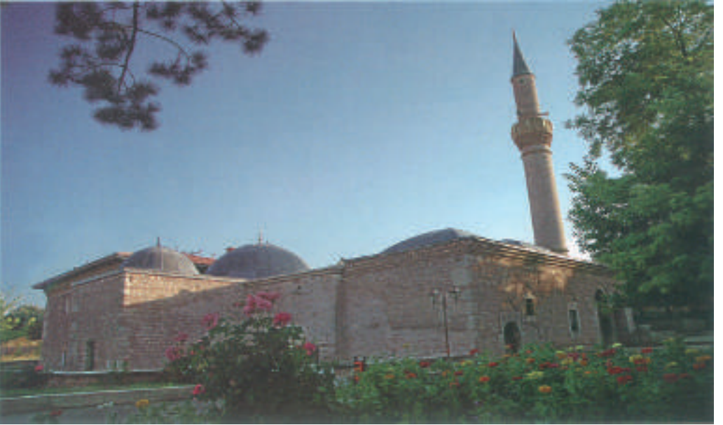
Caminin Dıştan Görünümü