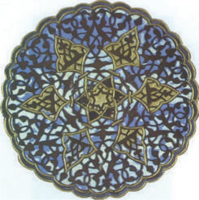
Garibname- Cilt Kapağı Motifi