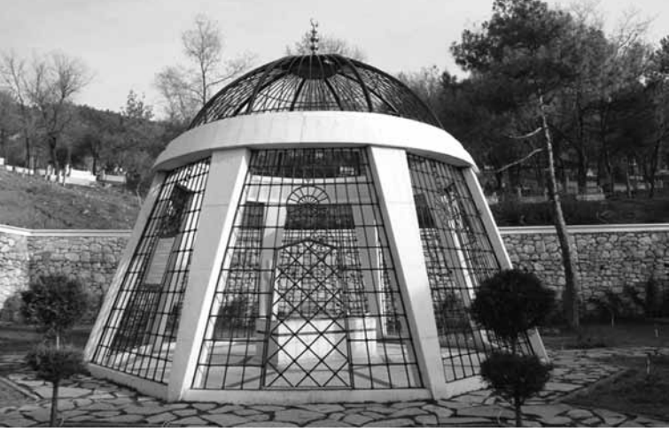
Atf Hoca'nın anıt mezarından görüntüler