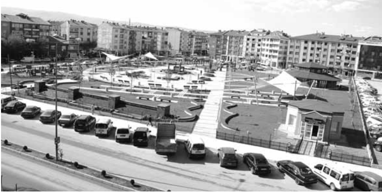
Atıf Hoca Parkı

Atıf Hoca'nın adı ve hatıraları, Çorum'da bir parkta ve İskilip'te bir hastanede yaşamaktadır.