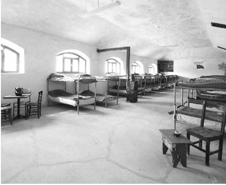
Ulucanlar Cezaevi'nde Atıf Hoca'nın kaldığı koğuş