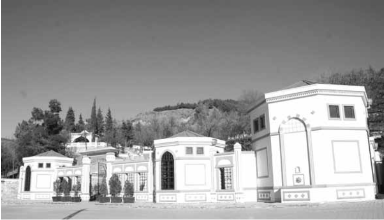
İskilip - Atıf Hoca Külliyesi ve Anıt Mezarı

“Çevresinde her gün Fatihalara açılan eller, İskilipli Atıf Hoca’yı Gülbaba ile birlikte kıyamete kadar şad edeceklerdir.”