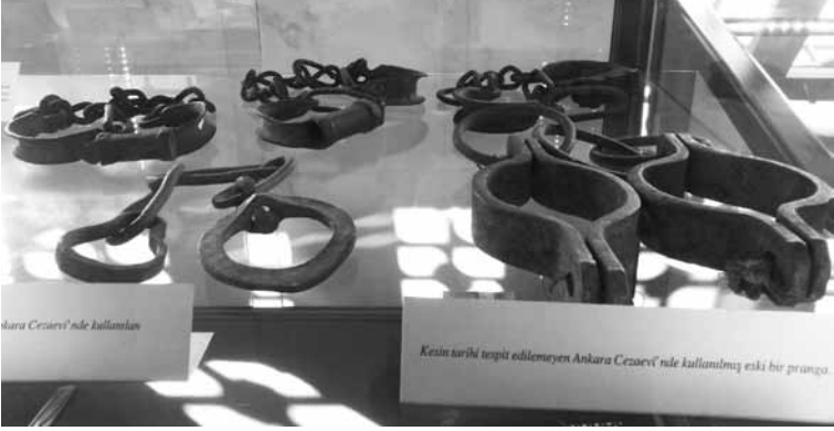
Ulucanlarda idamlıklara takılan kelepçe ve zincirler