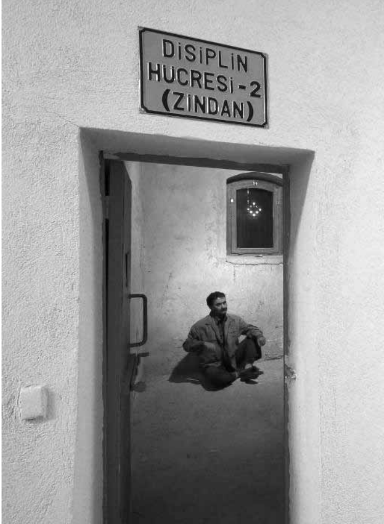
Ulucanlar Cezaevi'nde bir zindan