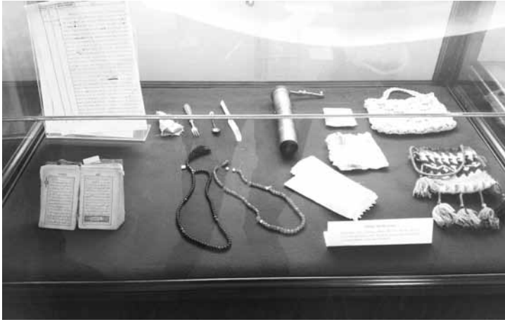
Atıf Hoca'nın özel eşyaları Ulucanlar Müzesi'nde

Atıf Hoca'nın idam kararında imzası bulunan üç Ali'den biri olan Kılıç Ali'nin İstiklal Mahkemesi'ni de içine alan ve çok partili dönemde yayınlanan geniş bir hatırat kitabı vardır. Ancak Kılıç Ali, o eserinde Atıf Hoca ve arkadaşlarının duruşmalarına hiç değinmemiştir. Yedi yüz sayfayı aşkın anıları içinde Atıf Hoca'nın adı, hiç geçmemiştir. Kılıç Ali acaba bu idam kararını unuttuğundan mı yoksa bu karardan utandığından mı zikretmemiştir, bilemiyoruz. Onun yazacağı iki satırlık bir açıklama, belki bütün tartışmaların önüne geçebilirdi.