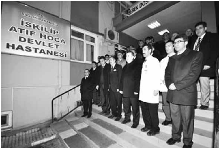
Atıf Hoca Hastanesi