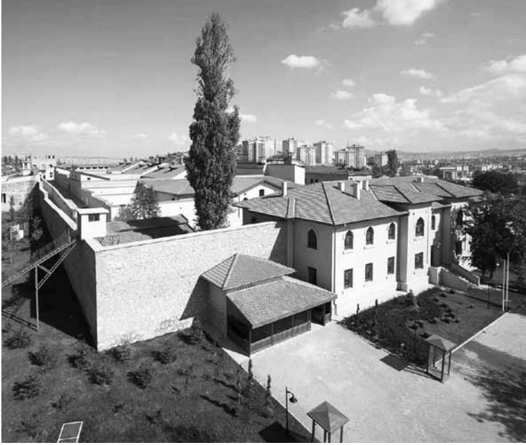
Ankara Ulucanlar Cezaevi (bugün müze halindedir)