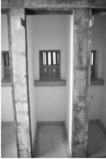
Ulucanlar'da tek kişilik hücre