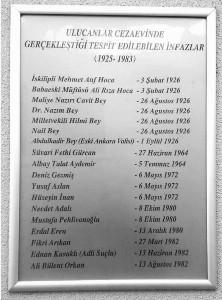
Ulucanlar Cezaevi 'ndeki infaz listesi