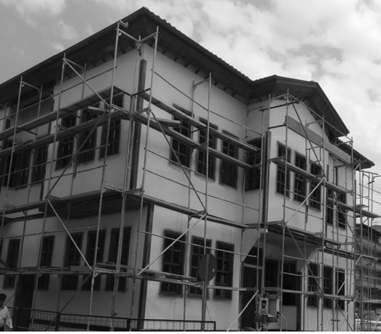
Laçinli Paşa'nın konak (restore halinde)

İlk anda 45 öğrenci kaydoldu ama ayrılanlar ve devamsızlıktan kalanlar nedeniyle bu ilk öğretim yılı 39 öğrenciyle sürdürülebildi. Sıralar derlemeydi. Harman zamanı köylere çıkılıp yardım toplanmak suretiyle okulun bir takım ihtiyaçları karşılanabiliyordu. Zaten bakanlık sadece bir öğretmen kadrosu vermiş ve diğer ihtiyaçların yerel halk tarafından karşılanması şartıyla okulun açılmasına izin vermişti. Binanın fiziki kapasitesi de gelişmeye imkan vermiyordu. Acilen yeni bir binanın yapılmasına ihtiyaç duyuluyordu.