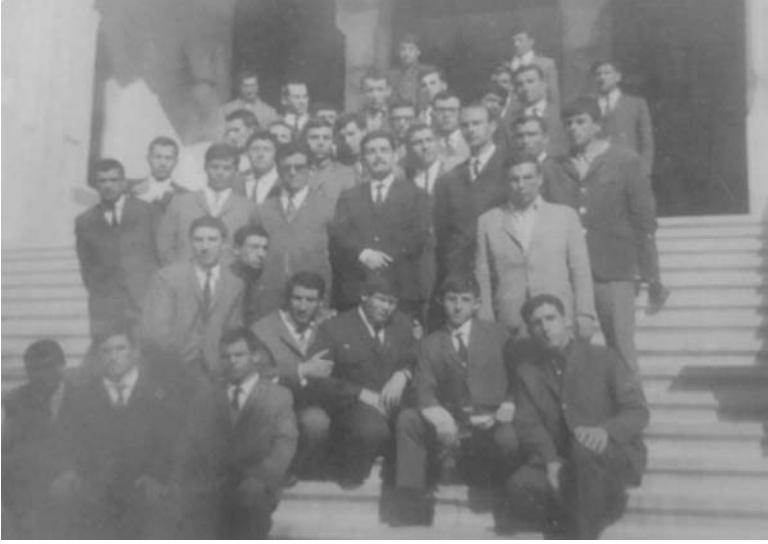
İdare binasının merdivenlerinde öğrencilerle birlikte

Her etkinlikle Çorum'da büyük bir heyecan ve coşku oluşuyordu. Hocamızın Çorum'dan ayrılışın-dan sonra bu kulüp de belli grupların eline geçti ve o heyecan söndü.