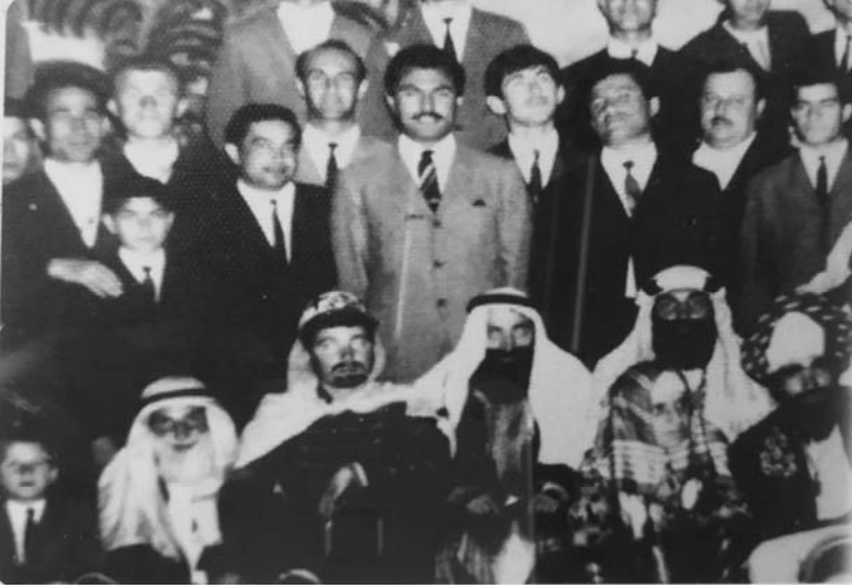
“Onlar Böyleydi” piyesinde rol alan öğrenciler