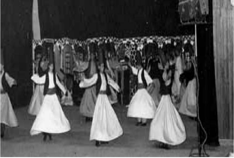
Mevlana İhtifalinde sema gösterisi