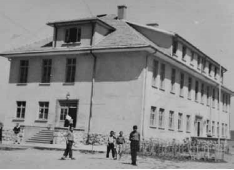
Çorum İmam Hatip Okulu idare binası

Burada bir hususu daha belirtmeden geçemeyeceğim. Bu arsa üzerinde aynı tarihte iki bina yapılmıştır. Birisi tamamlanıp ifraz işlemleri ikmal edildikten sonra Öğrenci Yurdu olarak kullanılmak kaydıyla Vakıflar Genel Müdürlüğüne devredilmiştir. İkincisi de İmam Hatip Okulu binası olarak hizmete sunulmuştur. Arsa ve binanın tapusu da taahhüt edildiği gibi İmam Hatip Okulu olarak kullanılmak kaydıyla, vali ve resmi zevatın da katıldığı bir törenle 10.1.1959 tarihinde Milli Eğitim Bakanlığına devredilmiştir. Bu bina, halen Çorum İmam Hatip Lisesi'nin idare binası olarak hizmet vermeye devam etmektedir.