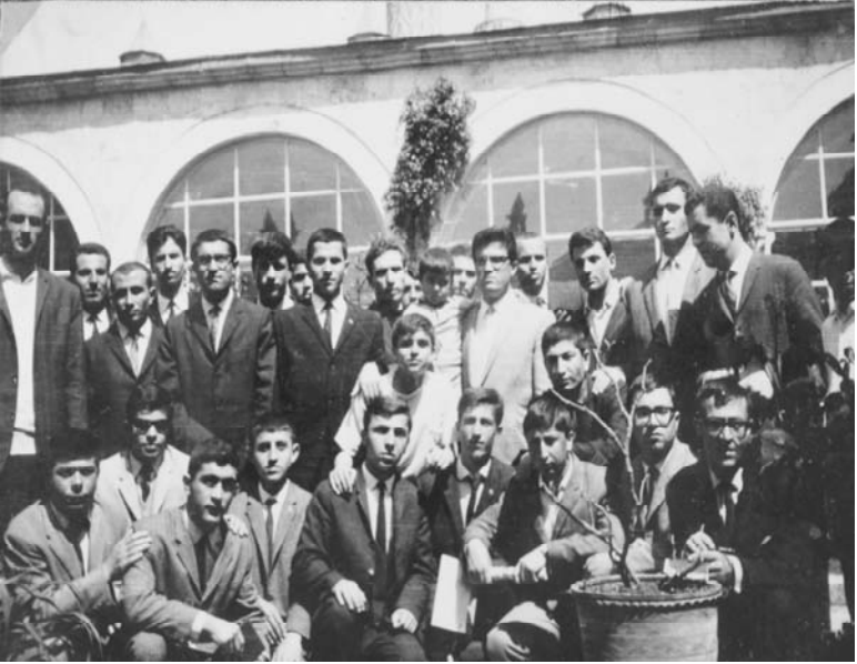
Amasya'da öğrencilerle birlikte

çalışı- yordu. Ev ziyaretleri ile onlarla daha sıkı ilişkiler kurmaya çabalıyordu. Tarih ve kültür bilincini artırmak için öğrencileri Amasya, Konya gibi bazı şehirlere götürüyordu.