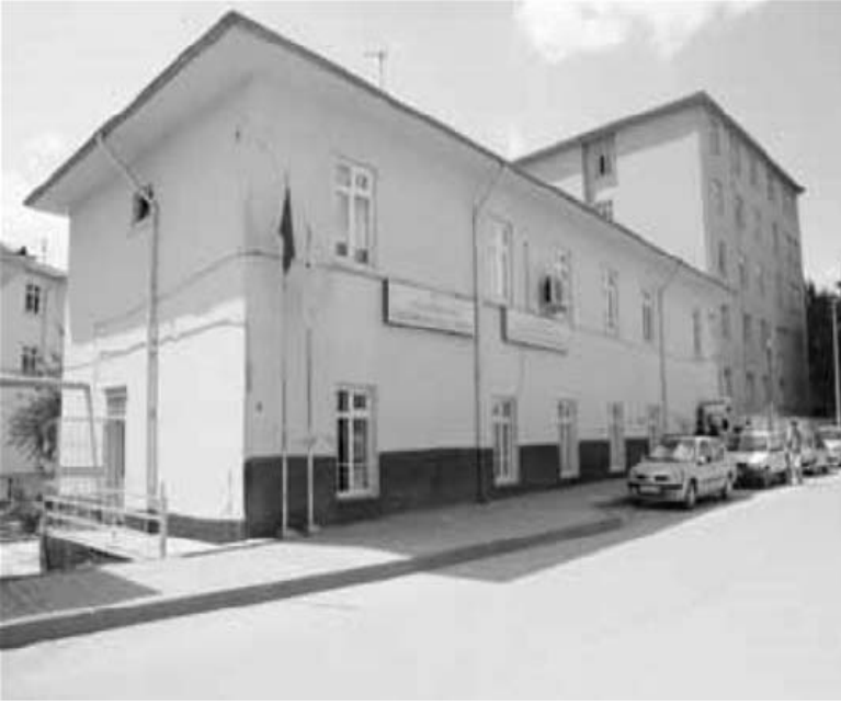
Vakıflar Öğrenci Yurdu

Ama en ideali parasız yatılı imkanını sağlamaktı. O sağlanıncaya kadar öğrencilere gıda, giyim kuşam ve harçlık yardımına devam edilecekti. Dernek imkanlarıyla idare binasının bodrumunu yemekhane, Güvercinlik adı verilen çatı katını da yatakhane yapmak suretiyle geçici bir yatılı sistemi kurulmuştu.