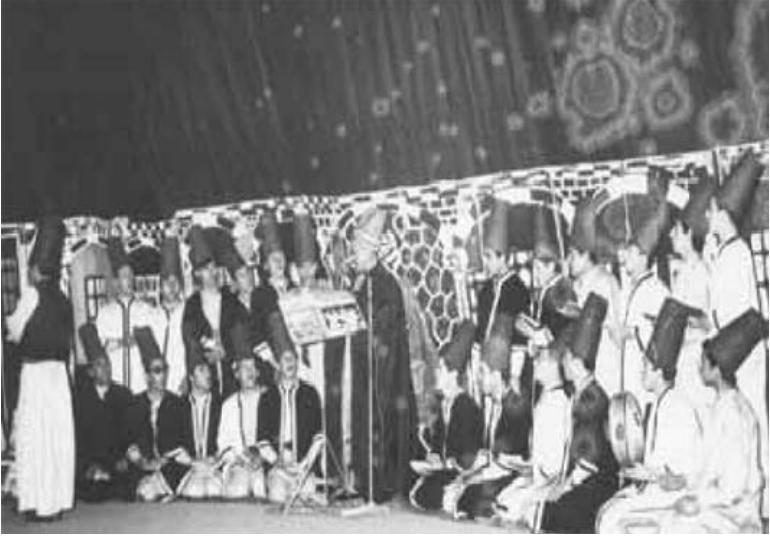
Mevlana anma töreni ve semazenler