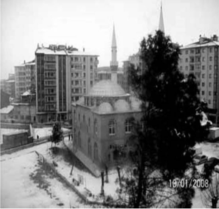
İmam Hatip Okulu Tatbikat Camii

Okul büyüdükçe ve öğrenci sayısı arttıkça, hem mahallenin ihtiyacını karşılayacak, hem de öğrencilerin uygulama yapacağı bir camiye ihtiyaç duyulmaya başlamıştı. İşte bu duygularla alınan bu mekana cami yapımına başlanılmıştı, hem de yontma sarı taştan. Sarı taşı da rast gele kullanmamıştı. Önce numune getirip denemişti. Kızgın güneşte beklettiği küçük boyuttaki taşları buzdolabına sokarak sıcak ve soğuğa karşı dayanıklılığını test etmişti. Buzdolabında iki-üç ay kadar bekledikten sonra çıkartıp çatlama veya parçalanma olup olmadığını inceledikten sonra bu taşlarla ördürmüştü duvarları.