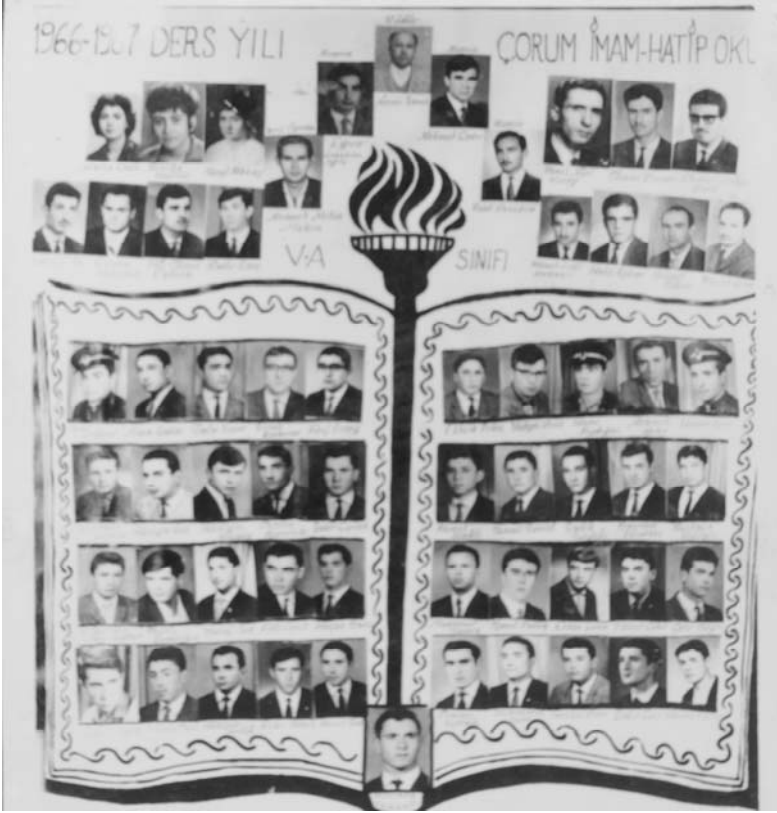
1966-1967 öğretim yılı 5 A sınıf albümü