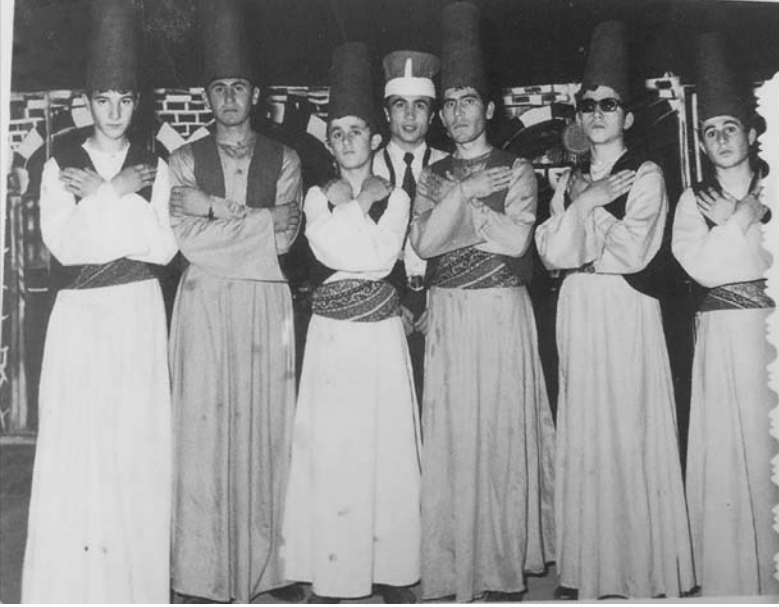
Mevlana İhtifalinde Semezen grubu