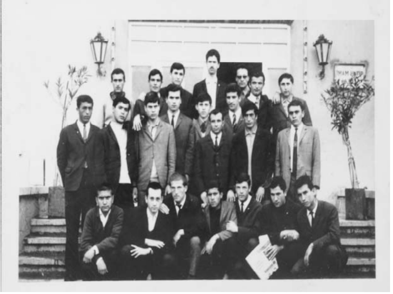
Arapça kursu verdiğim karma sınıf

En önemli yönü, sorunlu öğrencilerle bizzat ilgilenmesi idi. Onların kaldıkları yerleri ziyaret edip, sorunlarını yakından görüyor, dertlerini dinliyor, gerekirse maddi destek sağlıyor ve onları eğitim camiasına kazandırıyor. Bunun pek çok örnekleri vardı.